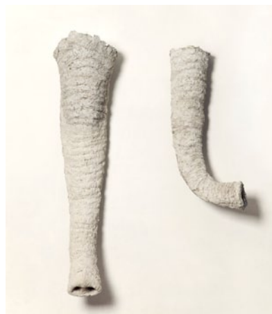
Laurent Le Deunff, Trompes , 2012, papier mâché, ciment, 63 x 85 x 24 cm.

— L'inspiration vient parfois aux artistes par les biais les plus inattendus... Ce sont ainsi les magasins de coquillages des stations de bord de mer qui ont inspiré la prochaine exposition de Laurent Le Deunff au Frac Basse-Normandie, qui ouvre à partir du 6 juillet. Qu'on attende pour autant aucun kitsch dans la douzaine d'œuvres qu'il a produites pour l'occasion : elles sortent de son atelier bordelais dans une âpre beauté de carton-pâte, et ne cèdent rien aux tentations du décoratif. Des coquillages, donc : on connaît l'amour que porte le jeune sculpteur en pleine ascension aux formes de la nature ; à l'idée de nature, plutôt. « Pièces atmosphériques, qui dégagent pas mal de choses », ses conques plus ou moins alambiquées naissent dans le sillage d'autres éléments taillés dans la dent de vache ou la rognure d'ongle, qui souvent en reviennent à l'élémentaire dans une tendance qu'il revendique lui-même « un peu Boy Scout ». Mais plutôt que le bois, qu'il a souvent pratiqué ces dernières années, Le Deunff a préféré ces derniers mois travailler avec un alliage de papier mâché et de béton, technique empruntée aux « constructions de baraques dans le désert : il suffit de broyer le mélange avec une bonne perceuse, et le tour est joué ». À cet élément s'adjoignent quelques autres dénichés dans l'atelier, d'un tronc d'arbre qui traînait là depuis 2004 à un cylindre pêche melba, rassemblés au fil d'un processus « au jour le jour, très impulsif et intuitif ».